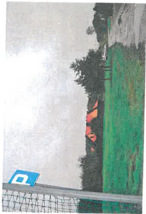
Teren zielony do zagospodarowania pod park wiejski