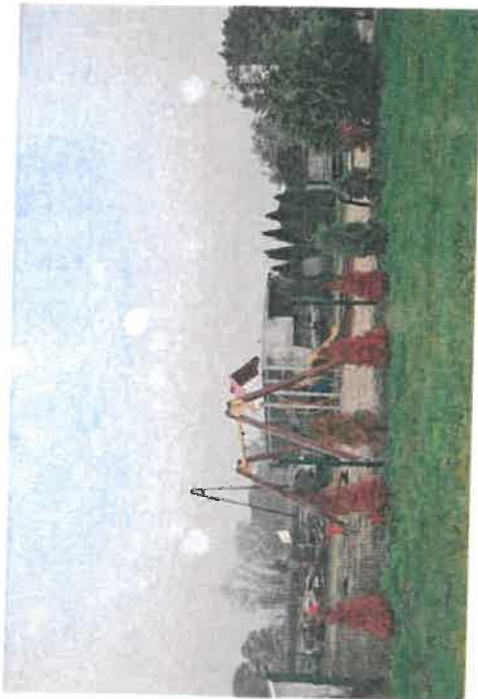
Plac zabaw w Koronowie