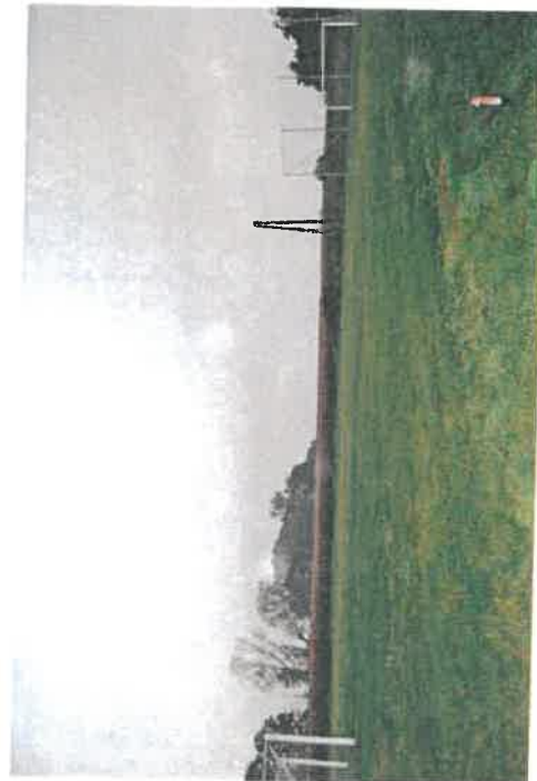
Boisko sportowe w Koronowie