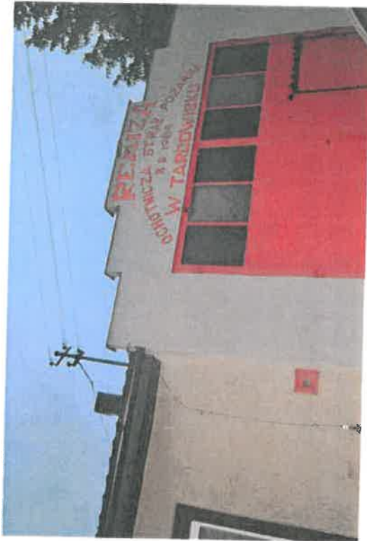
Remiza OSP Targowisko