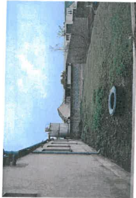
Teren za świetlicą wiejską