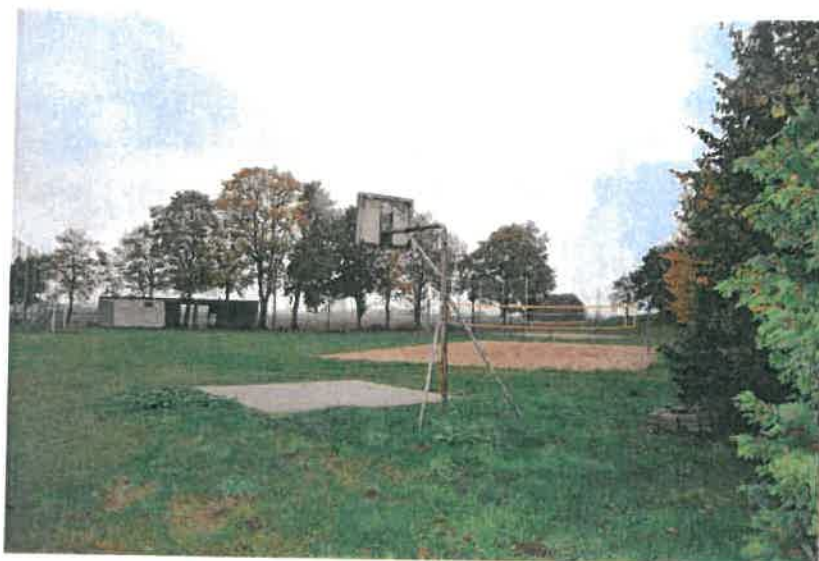
Teren rekreacyjny - sportowy