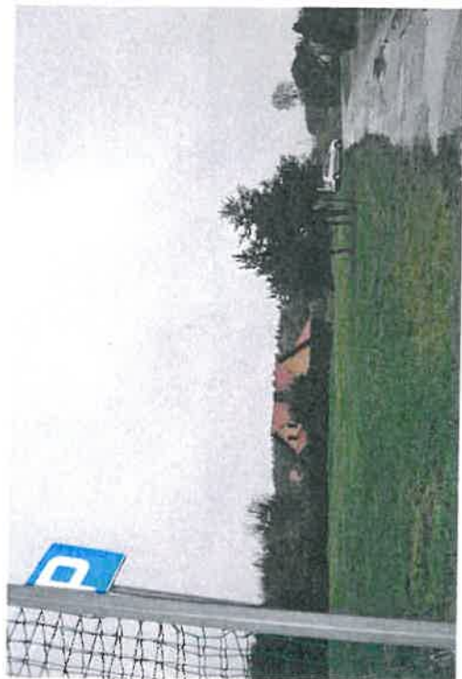
Teren zielony do zagospodarowania pod park wiejski