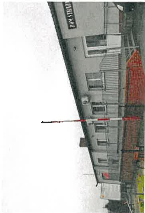
Świetlica wiejska w Radomicku