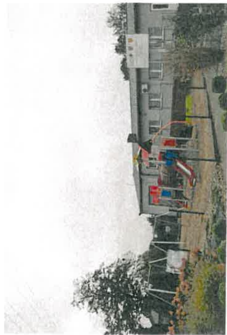
Plac zabaw w Radomicku