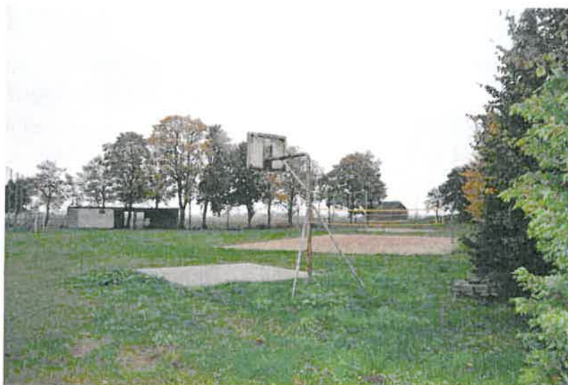
Teren rekreacyjny - sportowy