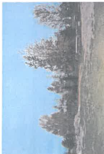
Teren do zagospodarowania