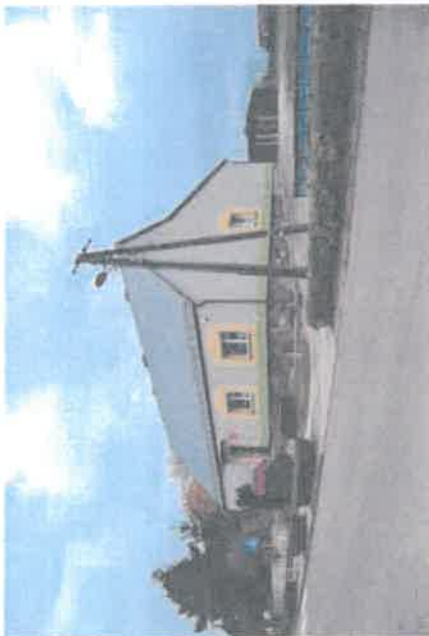
Przedszkole w Górcze Duchownej