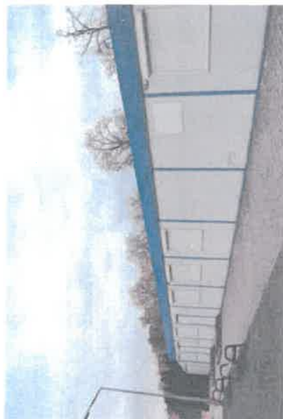
Świetlica wiejska (kontenerowa)