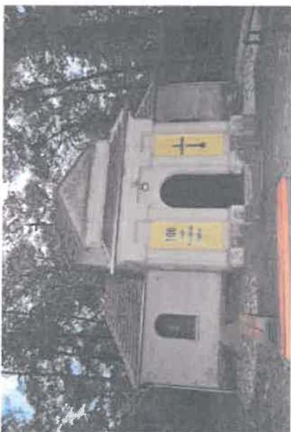
Kaplica w Klonówcu