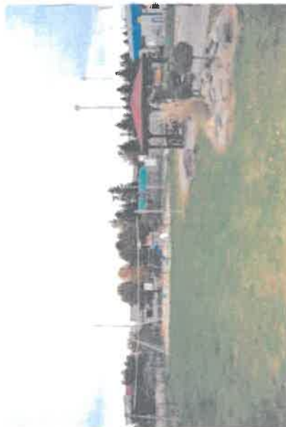
Skwer z placem zabaw przy ul. Jesiennej