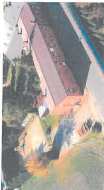
Świetlica wiejska z placem zabaw i boiskiem do kosza