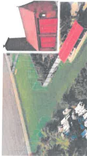
Boisko sportowe w sąsiedztwie remizy strażackiej