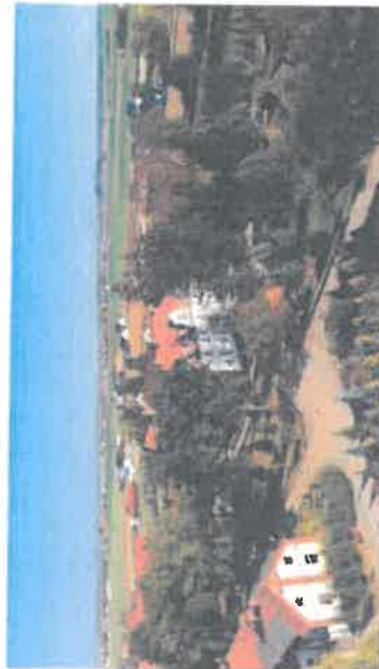
Nowicjat Towarzystwa Chrystusowego dla Polonii Zagranicznej