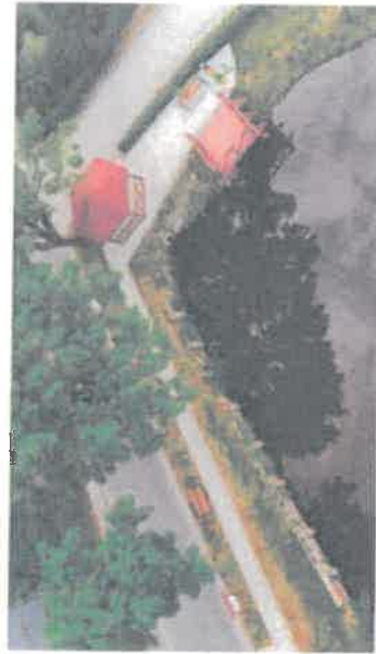
Kompleks rekreacyjno-edukacyjny przy stawie