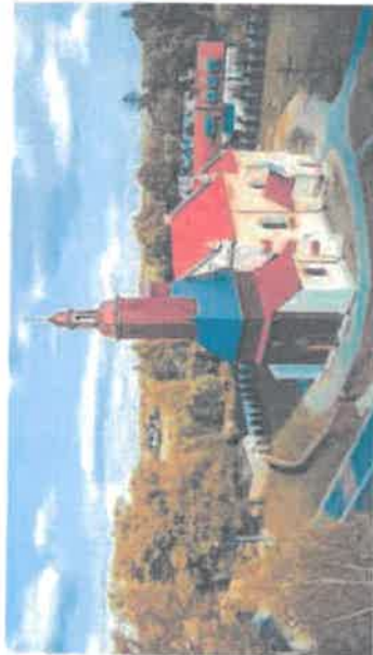
Kościół parafialny pw. Wszystkich Świętych