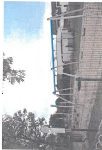
Plac zabaw na ul. Dworcowej