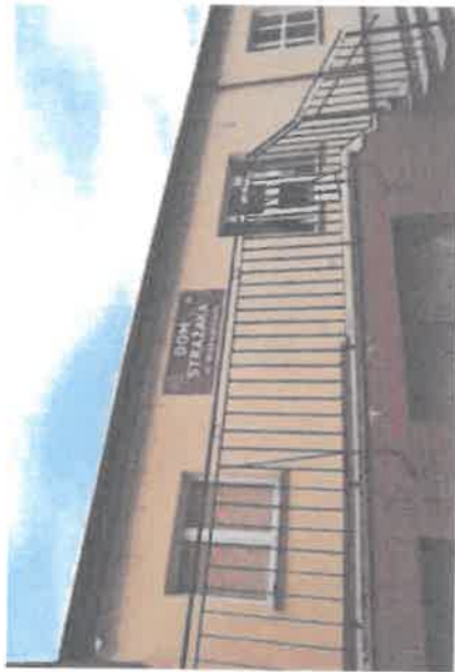
Dom Strażaka- świetlica wiejska