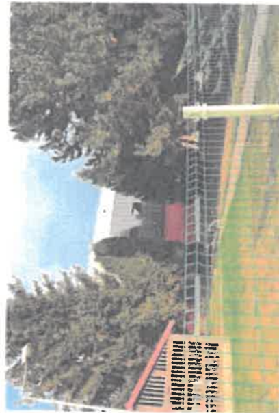
Teren za świetlicą- do zagospodarowania