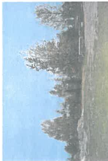
Teren do zagospodarowania