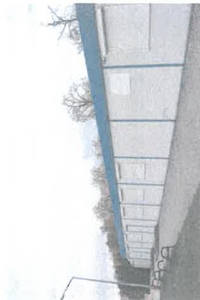
Świetlica wiejska (kontenerowa)