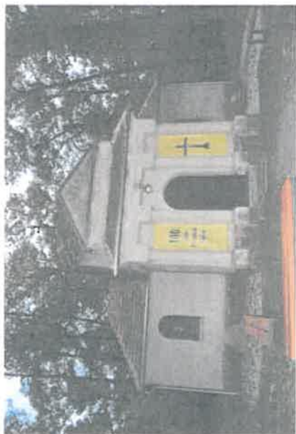
Kaplica w Klonówcu