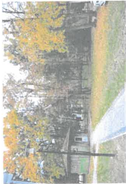
Park z widoczną w tle częścią do zagospodarowania