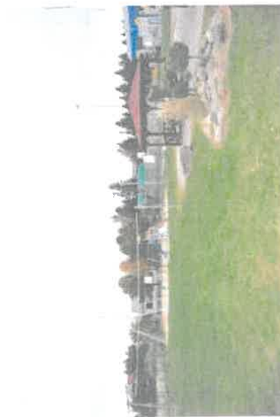
Skwer z placem zabaw przy ul. Jesiennej